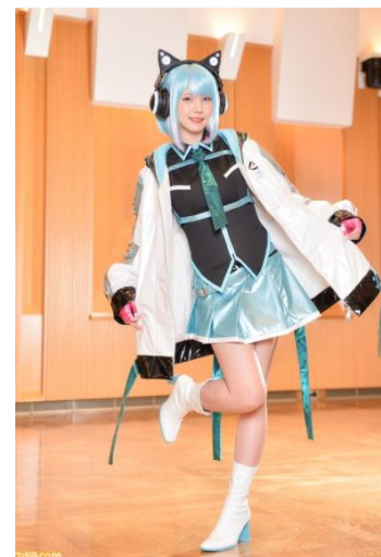
(えなこ 独占インタビューカット)

また、東京eスポーツフェスタ2022会期中の模様もファミ通.comにて紹介していく予定です。