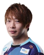
板橋ザンギエフ (DetonatioN Gaming)