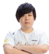
Toki (AXIZ WAVE)